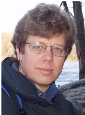
Guido van Rossum